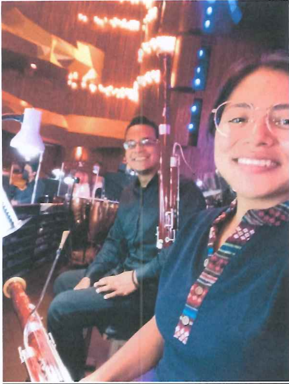
Foto de Ensayo No. 11 Fagot I.

17:50 a 20:00 se inició con el Pre Ensayo General del Acto III con todo el elenco de la Ópera.