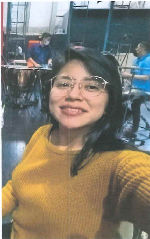
Foto ensayo II. Fagot I.