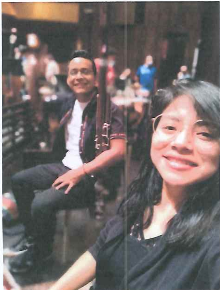
Foto de Ensayo No. 9. Fagot I

Se ensayó con la Orquesta, Coro, Solistas y el Ballet. Se dio de principio a fin del Primer Acto parando solo en algunos fragmentos de mismo. El Segundo acto de vio hasta el número 14. El Viejo Guerrero escena de la Traición luego se nos sedió un espacio de 15 minutos para poder ir al baño y beber agua. Se continuó con el acto 2 hasta la primer escena del 3er acto parando para dar especificaciones en la Danza Salvaje 23, corrigiendo el tempo y haciendo enfases en el solo de chelo y fagotes.