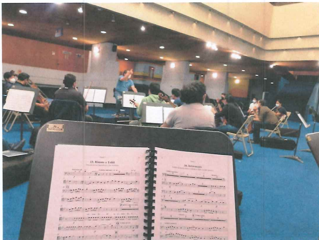
Foto del Ensayo I. Fagot I Orquesta Libertad

En este ensayo recibí las partituras en físico para el estudio individual en casa.