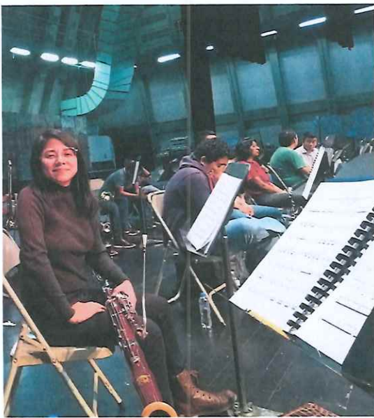
Foto de Ensayo No. 5 Fagot I

Se ensayaron número específicos de la Ópera. Del primer acto 2. Himno al Sol compás número 14 solo de 2 fagotes y tenor, se corrigió la lectura de tresillos y dirección musical. En el 3. Segundo Sacerdote el compás 30 con chelos se indicó el tempo y dinámicas. El aria 4. Algarabía Llegada de la muchedumbre se trabajo de inicio a fin con solo de fagote y trompeta, coordinación de estos dos instrumentos.