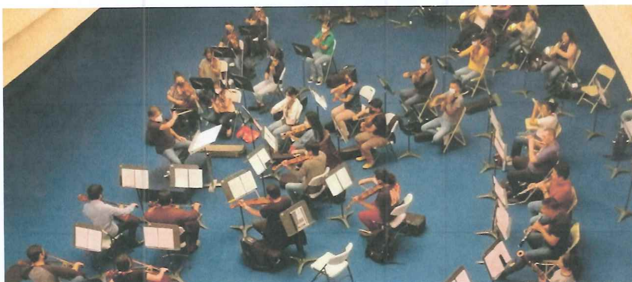
Foto del Ensayo No. 4. Fagot I.

Inició el ensayo con la 2da parte de la Opera, Aria 12 Danza de los Tesoros Escondidos Introducción al Segundo Acto. Se trabajó el solo de fagot que inicia en la ancrusa del compás 1 al 5, revisando los trinos hacia la nota superior, la afinación y tempo con los violonchelos. En el aria número 18. Captura de los Principes se trabajo la agógica ya que tiene varios cambios importantes iniciando con un Grave, animado un poco, Andante hasta llegar a un Allegro Giusto y furioso. Se tuvo un receso de 15 minutos para beber agua e ir al sanitario, posteriormente se inicia con el Primer acto.