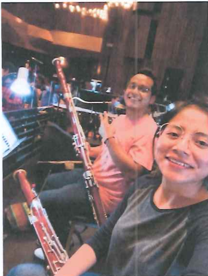
Foto de Ensayo No. 10 Fagot I

Se inició con El Primer Acto de la Ópera K'iche` Winaq indicando que se tocaría piano para que los solistas se escucharan y no se distorcionara el sonido. El Segundo Acto se trabajaron partes de violín I, celos y violas. En el tercer acto se trabajó el Aria Profecía, Fanfarria y Final, indicando la entrada el corno en el compas 42 y en el compás 48 la entrada el Fagot aclarando que es un Fa#. En el aria 26 la Danza Salvaje continuación se indico que el solo de fagot iniciando en la anacruza la figuración lleva puntillo de articulación y en el compas 28 y 29 es una nota breve.