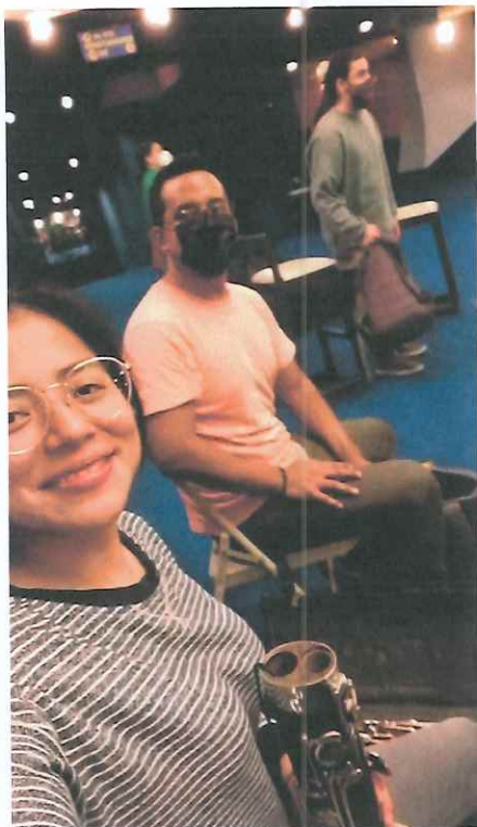
Foto de Ensayo No. 7 Fagot I

e rit. Para finalizar con el aria. Nos dieron un receso de 15 Minutos para volver a ensayar el 3er acto de la Ópera.